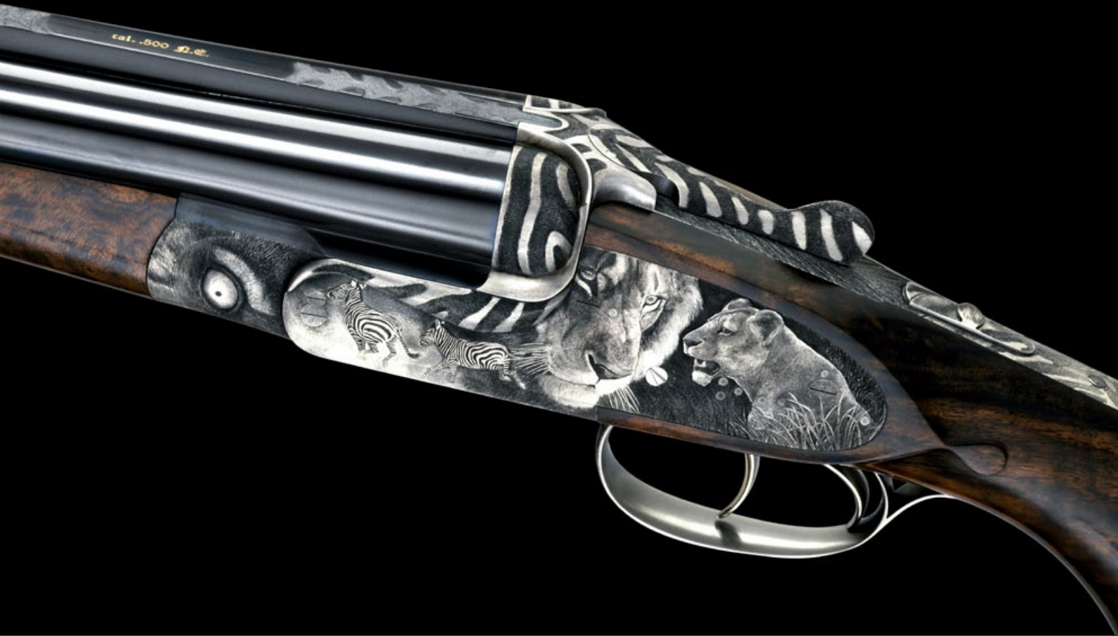
„Lion Fire” – Ritchi Maier / Fanzoj Ferlach