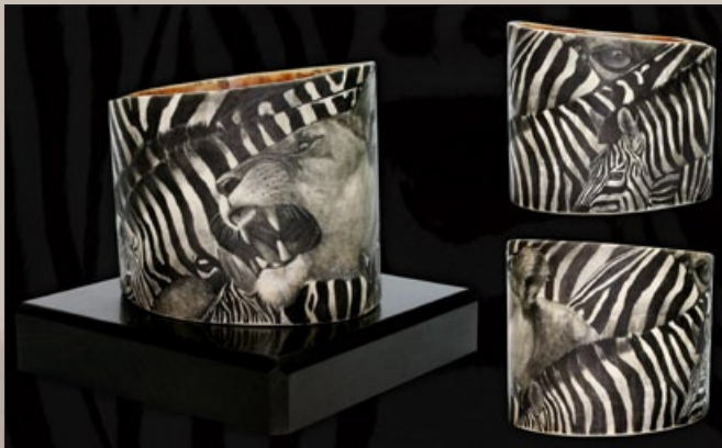
„Zebrasimba“ – Scrimshaw Gravur Ritchi Maier

Through the haze of time, to the origin of humanity. Hunt, heart, art. In bone the shaman carves his mark. A prophecy, a precious trophy. Precision, artistry, a steady hand, a keen eye. Cut with instruments of steel. A cutting-edge scrimshaw comes to life.