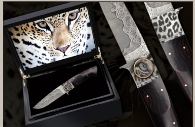
Luxusschatullen – Trompeter & Ritchi / Wildlife Art R. Kohl