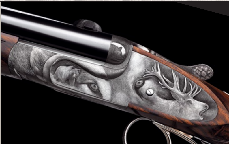
„Deer Hunter” – Ritchi Maier / Fanzoj Ferlach