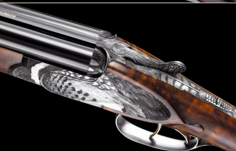
„The Pheasant Gun” – Ritchi Maier / Fanzoj Ferlach