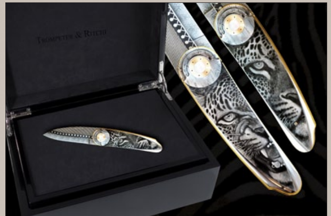
Purer Luxus – feine Handgravuren von Ritchi Maier