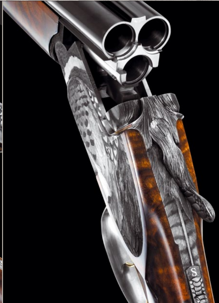
„The Pheasant Gun” – Ritchi Maier / Fanzoj Ferlach