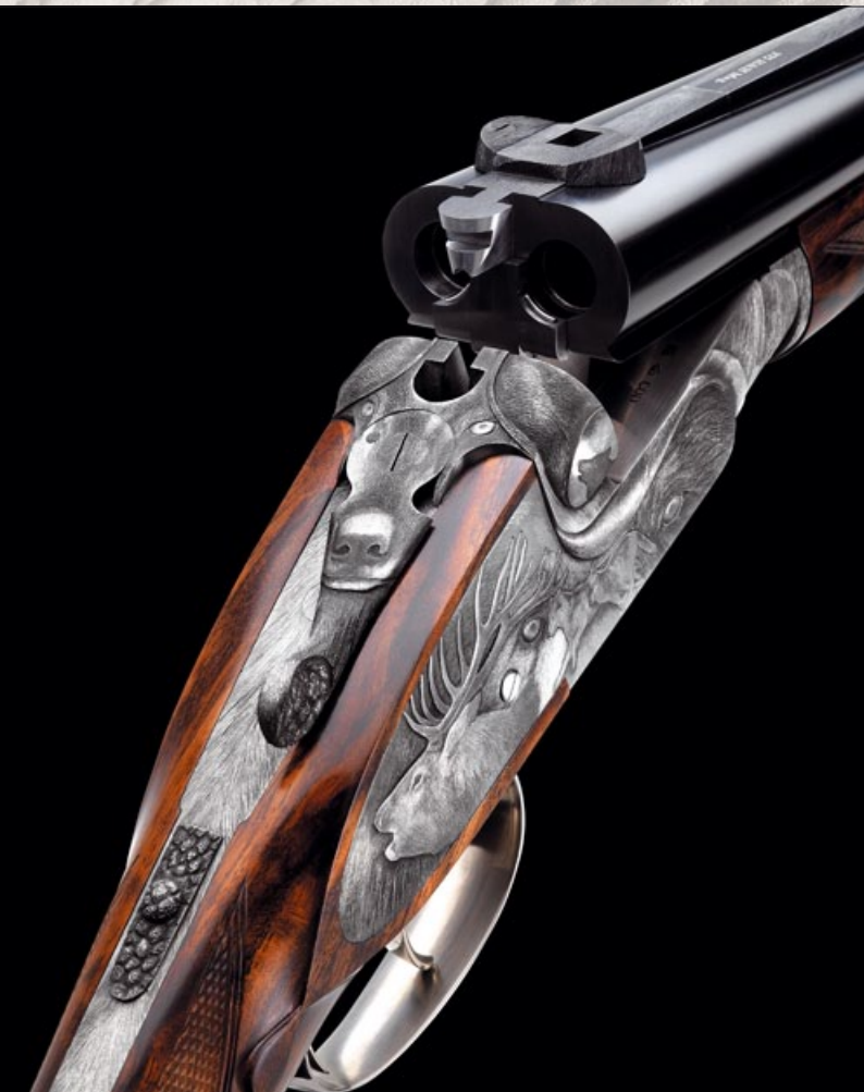
„Deer Hunter” – Ritchi Maier / Fanzoj Ferlach