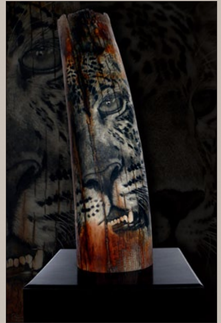
Wildlife Scrimshaw Gravuren – Ritchi Maier | Wildlife Scrimshaw Engraving – Ritchi Maier